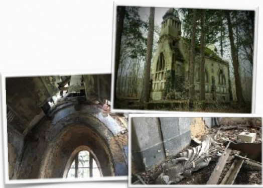
Kaple byla vystavěna v letech 1899 až 1900 pro majitele místní továrny na samet Friedricha Wilhelma Botschena.

Ze stavebního posouzení kaple provedeného v roce 2017 vyplynulo, že objekt je možné zachránit, ale také to, že je co nejdříve nutné zajistit novou střechu a provést několik stavebních zásahů. Předběžný rozpočet na sanační práce je přibližně 700.000,-. Věříme, že najdeme dost lidí, kteří budou chtít pomoc a proto jsme vyhlásili tuto sbírku. Podali jsme také žádosti o finanční podporu u vybraných nadací a budeme se pokoušet sehnat finance i od Ústeckého Kraje a státu.